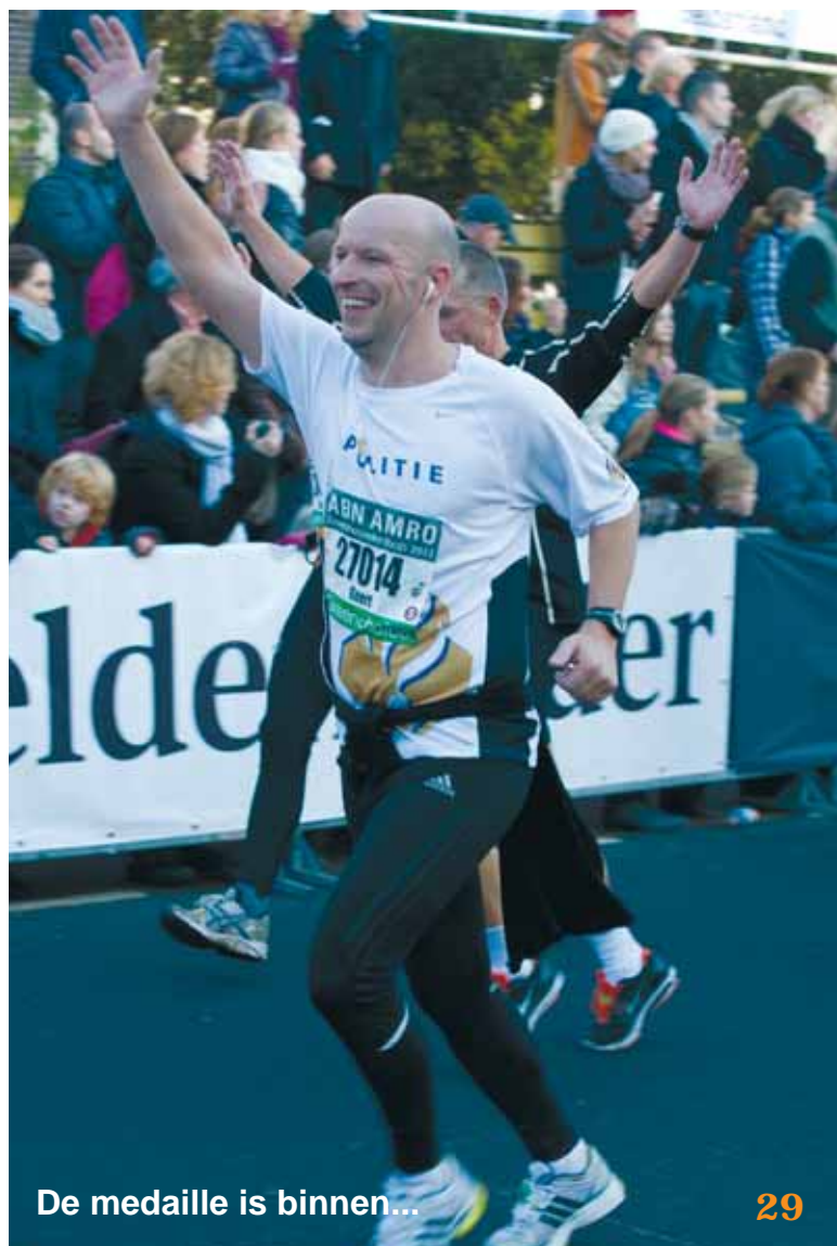
De medaille is binnen...

Rijen publiek, speakergeluid en drommen lopers, maar Nijmegen had haar wereld op slot gedaan. Bij een temperatuur van acht graden en dichte mist was de wereld even klein. Ochtendnevel, winterzon en geurige bossen. Dat was de verrassing van de Zeven Heuvelenloop. Eenmaal in Groesbeek en Berg en Dal brak het zonnetje door en werd het aangenaam warm. Daar ergens – ter hoogte van hotel Erica – bij het 11 km-punt weten de ervaren lopers dat het vanaf dat moment alleen maar lekker over de rest van het parcours naar beneden gaat. De kilometers vlogen voorbij, de driehonderd politielopers genoten. De een liep voor een persoonlijk record, voor de ander was de finish het ultieme doel. Dat maakte niet uit. Eén ding stond vast, deze collega's liepen vandaag allemaal met hun hart. Dat bleek uit de brede glimlach op het gezicht bij binnenkomst in het personeelsrestaurant van het hoofdbureau. De medaille was binnen, vandaag werd de beloning geïncasseerd voor het harde werken van de afgelopen maanden.