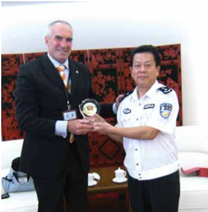
Ontmoeting met de Chinese Secretaris – generaal Sun Hangnan van de Chinese politie sportbond in Beijing