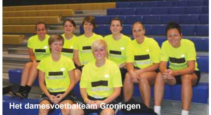
Het damesvoetbalteam Groningen

Na een aantal jaren kwam het verzoek van de meespelende dames (in de herenteams) om een aparte damescompetitie op te zetten. In 2009 zijn we daarmee begonnen. Vier regionale teams vanuit het land kwamen spelen, in 2010 waren het vijf damesteams en voor 2011 hadden zich zeven teams ingeschreven. Maar toen kwam 'Baflo' en werd het hele toernooi afgelast. Als bestuur hadden we toch het gevoel dat een jaar zonder voetbal een beetje een gemis zou zijn, derhalve werd het toernooi alsnog gespeeld. Helaas was het deze keer het meerdaags internationale zaalvoetbal toernooi in Eibergen dat ons een aantal damesteams kostte. Niet op de politiekalender, dus geen rekening mee gehouden, werd het in dezelfde week gespeeld. Gelukkig waren de damesteams van Groningen, IJsselland, Noord-Holland-Noord en Zaanstreek-Waterland er nog wel.