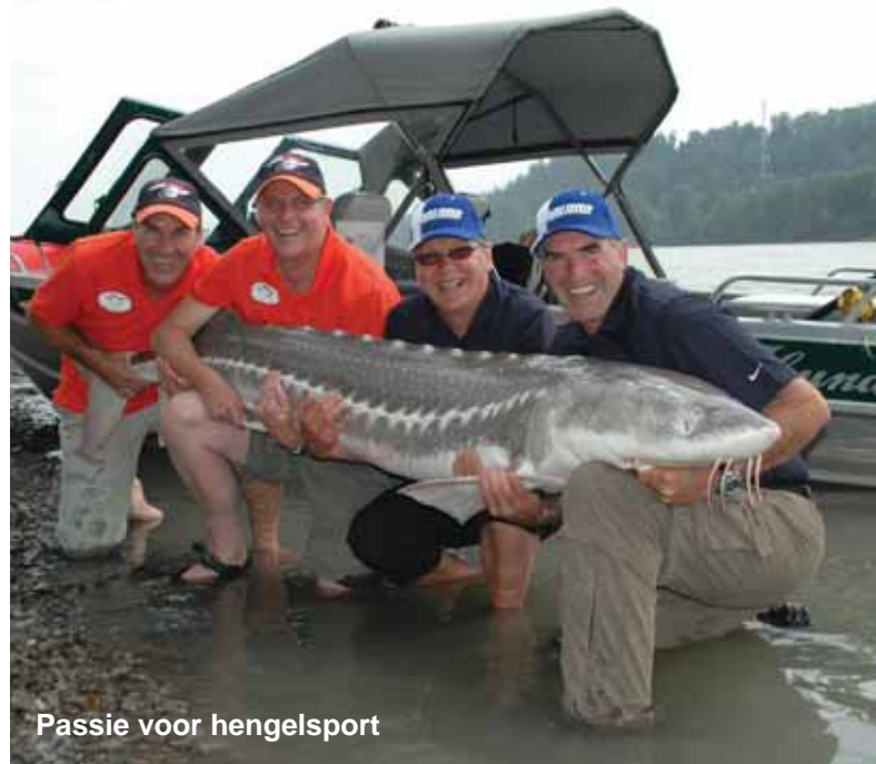
Passie voor hengelsport