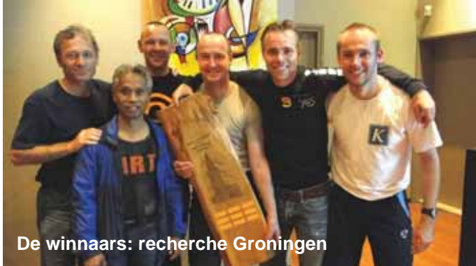
De winnaars: recherche Groningen

Donderdag 13 oktober 2011 werd voor de tiende keer het noordelijk zaalvoetbaltoernooi gespeeld in Leek, nabij Groningen. Uitgegroeid van een onderling toernooitje in een sporthal met één veld, naar een voor alle noordelijke politie voetballers vast begrip het 'ZVT Leek'.