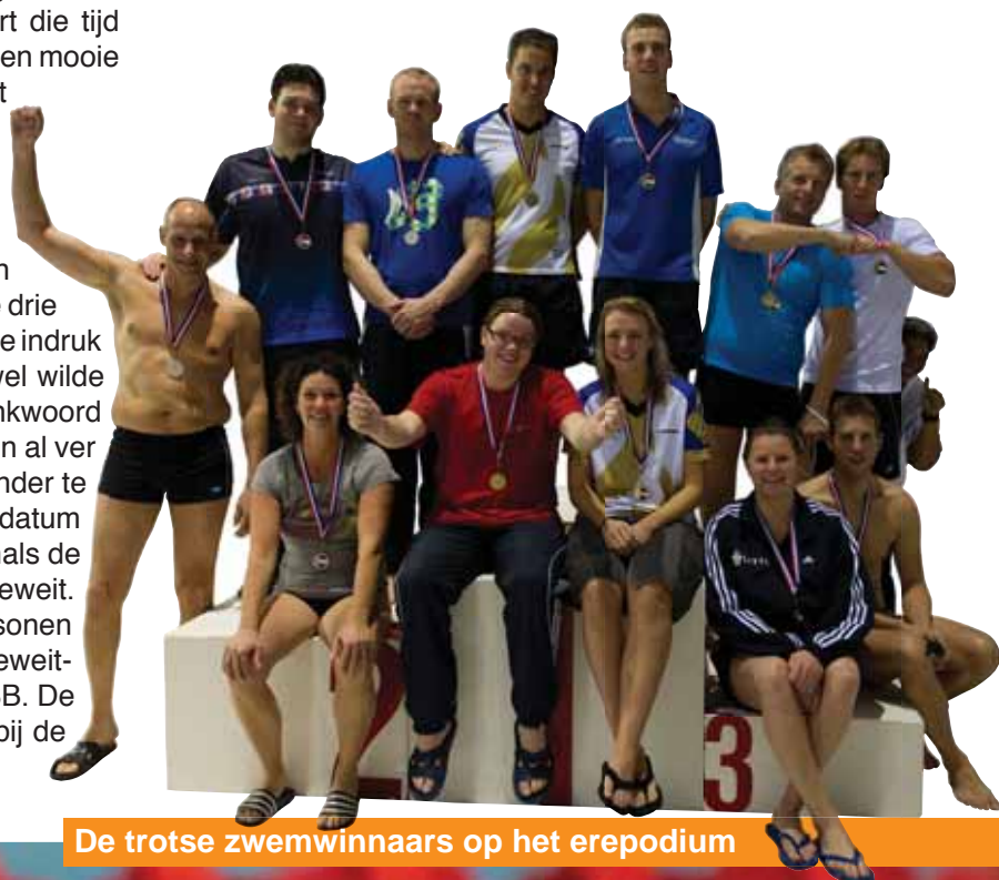
De trotse zwemwinnaars op het erepodium

De zwemgedelegeerde nam als laatste en in z'n eentje (onvrijwillig) afscheid van het bad, waar we drie jaar gastvrij zijn ontvangen. Er bestond kennelijk de indruk dat hij het record van de dag mét uniform nog wel wilde breken. Maar verder dan een nat pak en een dankwoord voor het aanwezige publiek kwam het niet. We zijn al ver met een regio om het komende NK Zwemmen onder te brengen en we hopen voor de jaarwisseling de datum en plaats van handeling te kunnen melden. Evenals de datum en vooral teamstelling voor het WK in Koeweit. Met een gemengd team van ongeveer tien personen hopen we in het voorjaar af te reizen naar Koeweitstad, vanzelfsprekend onder de vlag van de NPSB. De resultaten uit het verleden zullen we betrekken bij de samenstelling van deze zwemdelegatie.