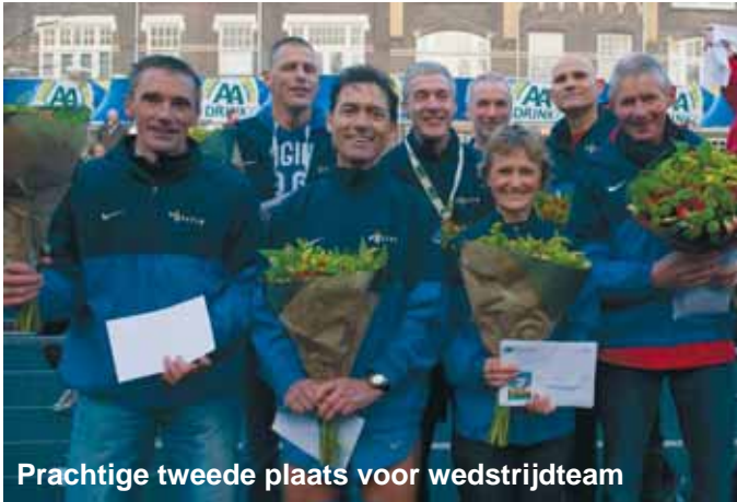
Prachtige tweede plaats voor wedstrijdteam

Grote vreugde in die kleine wereld was er bij de wedstrijdlopers die de tweede plaats bereikten van ruim 800 teams. Proficiat! Tegen het grote geweld van de winnaar – de Radboud Universiteit – viel niet te strijden.