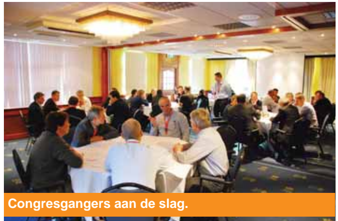
Congresgangers aan de slag.