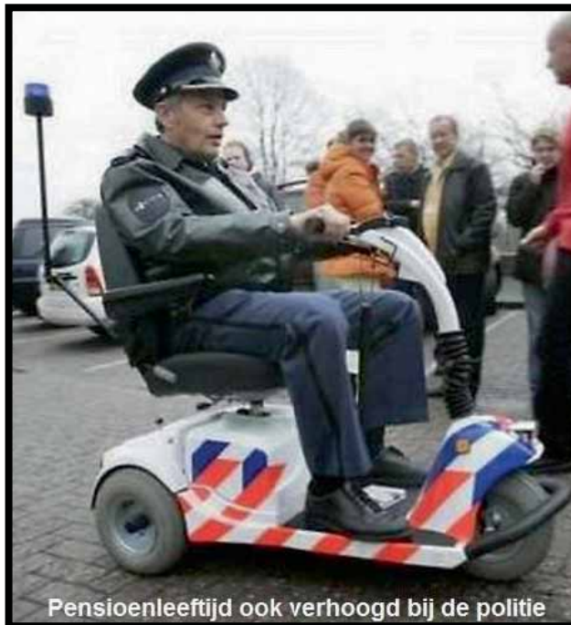
Pensioenleeftijd ook verhoogd bij de politie

eind april 2011. travel@ipa-nederland.nl Opgave aan de organisatie in Ierland doet de algemeen secretaris van IPA Nederland. Meer informatie kunt u lezen op de website www.ipaireland.ie