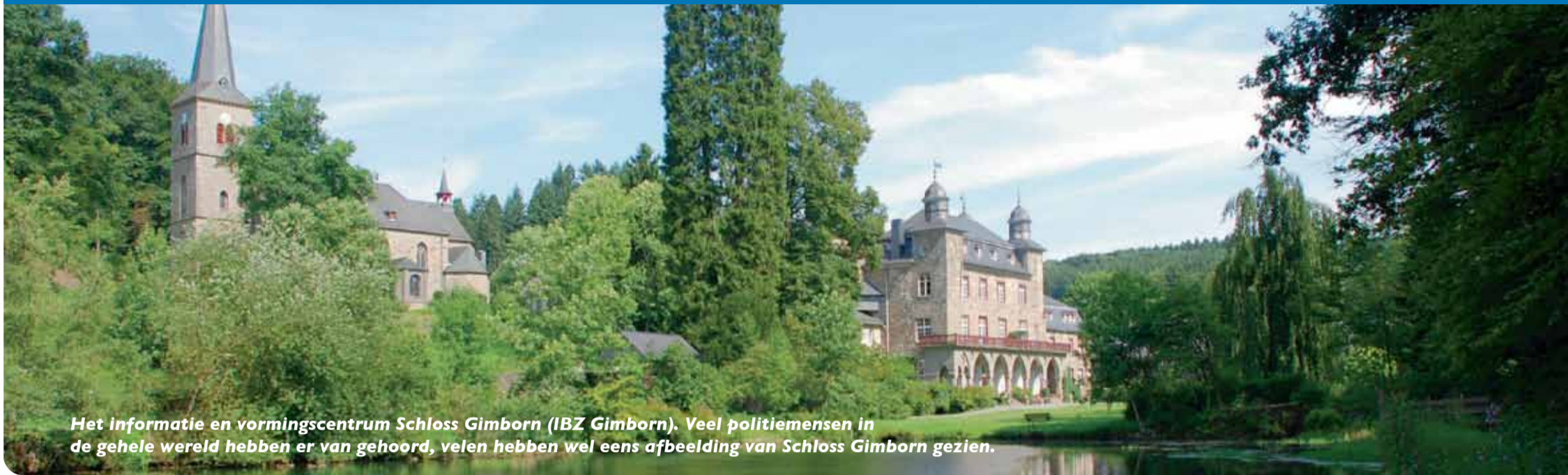
Het informatie en vormingscentrum Schloss Gimborn (IBZ Gimborn). Veel politiemensen in de gehele wereld hebben er van gehoord, velen hebben wel eens afbeelding van Schloss Gimborn gezien.

Eéndaagse seminar of symposium in eigen land kost vaak al honderden euro's. De financiële steun van IPA Nederland en de districten maakt het mogelijk om het seminar van één week, inclusief de volledige verzorging voor een gereduceerd bedrag aan IPA-leden aan te bieden. Niet IPA-leden betalen een hoger bedrag.